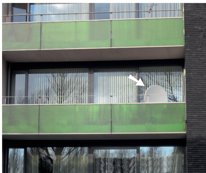
Schotelantenne goed geplaatst