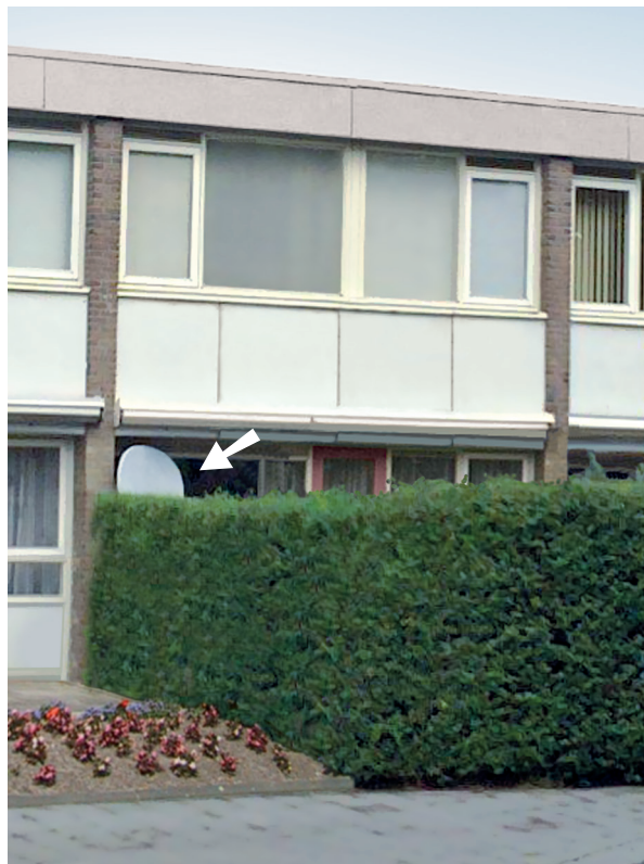
Schotelantenne goed geplaatst